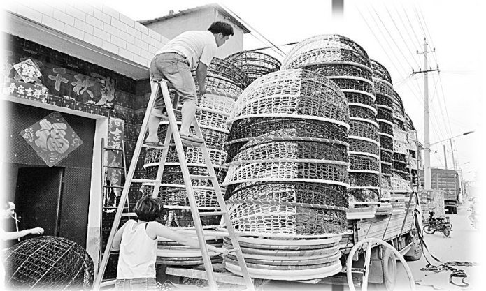
临河店乡程庄村藤编产业编织群众致富梦。