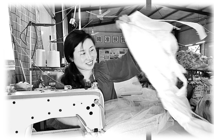
李口镇谷楼村精准扶贫车间里，女工正赶制演出服。

“目前，我们围绕补齐短板，正在强力推进十二项重点工作‘清零行动’，集中清除所有影响脱贫的障碍。”睢阳区委农办主任李建华说，今年，睢阳区制定了完成8个村、3800人的全部脱贫目标。在时间紧、任务重的情况下，强化措施落实，补齐短板弱项，对照“贫困户脱贫123、贫困村出列129”脱贫标准，围绕提高“三率一度”、增收措施等十个方面狠下功夫，坚决打好打赢脱贫攻坚战。