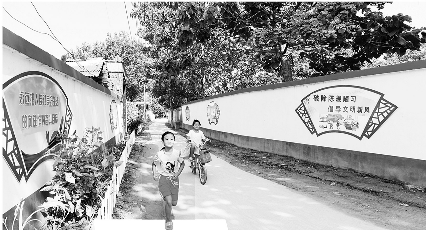
脚下是平整的水泥路，两侧是多彩的文化墙，冯桥镇安楼村村容村貌因脱贫攻坚而发生了巨大变化。