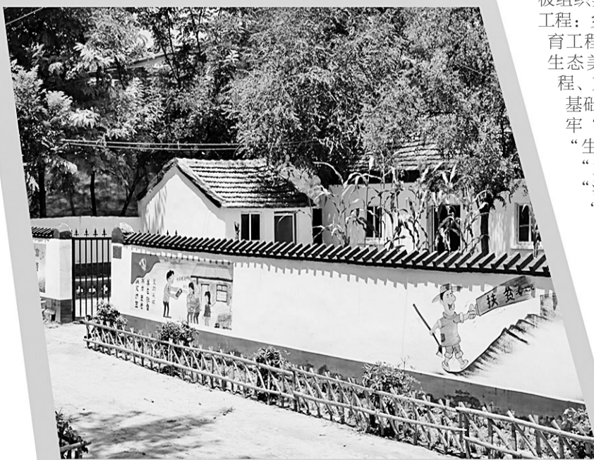
宋集镇大邓楼村“六改”提升后的贫困户家。