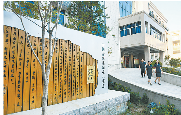
法院院内典雅古朴的中国古代法制名人名言木刻。

初秋时节，走进睢阳区人民法院，浓郁的文化建设氛围扑面而来；完美融入“古城元素”的法院文化长廊，从院内到大厅，从一楼到五楼，各具特色、独树一帜；“唱响新时代”夏季广场文化活动法院专场，歌曲、戏剧、曲艺、手语、朗诵，15个节目全是法官自编自演，精彩纷呈；“勿忘历史、展望未来”经典诵读大赛，14名干警以饱满的热情、生动的语言、真挚的情感将经典作品朗诵…… 习近平总书记十九大报告中强调，“文化是一个国家、一个民族的灵魂。”近年来，睢阳区人民法院把文化建设作为一项系统工程，以服务审判、服务干警、服务法治建设为目标，坚持古城文化、物质文化、精神文化、行为文化、制度文化“五位一体”化建设，为法院整体工作的进一步提高奠定了坚实基础，为建设平安、法治、和谐、幸福睢阳提供了有力支撑。