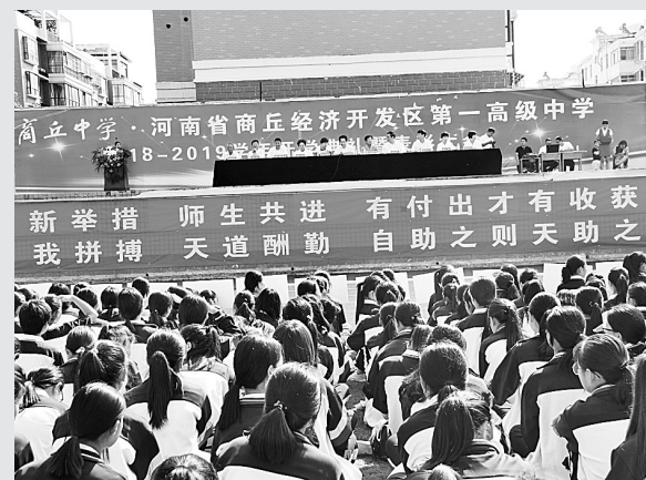
9月9日上午,商丘中学举行新学年开学典礼暨教师节表彰大会。该校领导班子及全校师生8200余人参加了开学典礼,并对优秀教师、优秀班主任进行表彰。