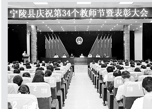
日前,宁陵县召开庆祝第34个教师节暨表彰大会,对2018年度优秀教师和优秀教育工作者、优秀班主任、师德先进个人进行了表彰。优秀教师代表在会上作了典型发言。