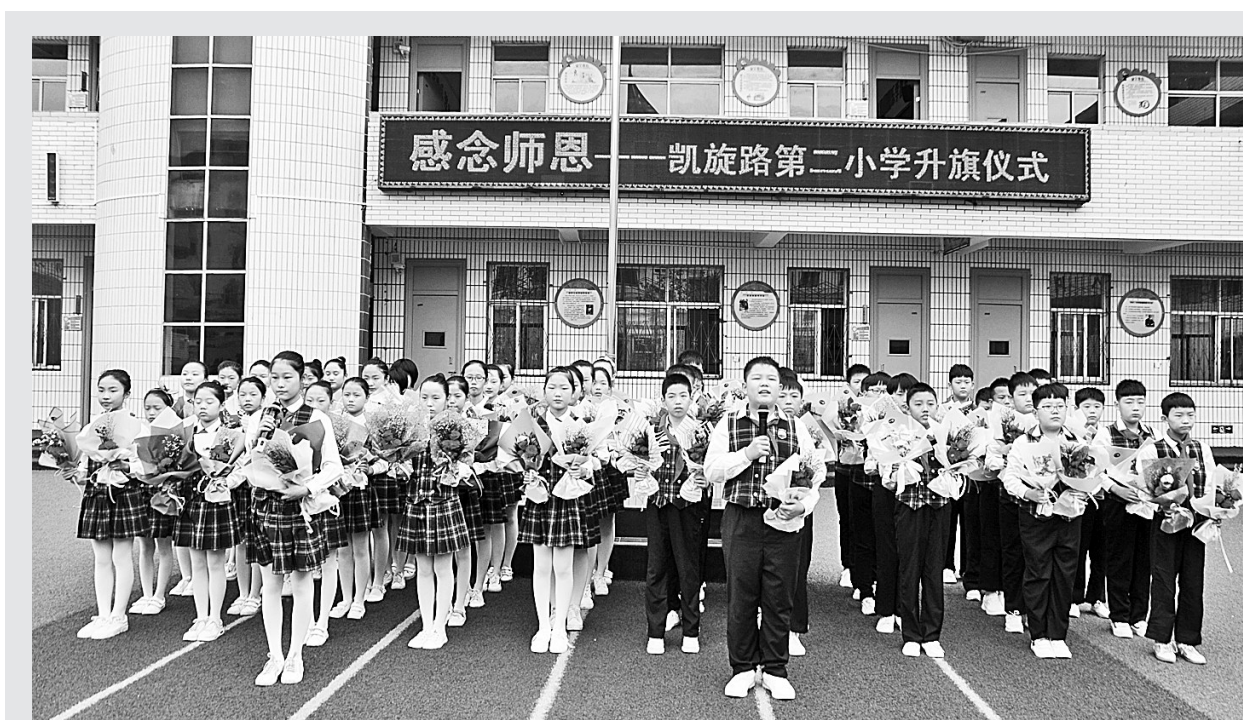
9月10日,商丘市凯旋路第二小学举行了“感念师恩 争先有为”升旗仪式。升旗仪式上,六三中队的小队队员代表全校所有学生向该校所有教师献词、献花,齐声祝福节日快乐!

讲座结束后,家长们纷纷表示,一定会和孩子、家人一起参与到“两城”联创工作中,争创文明家庭,争做文明市民。同时表示,在以后教育孩子的过程中,要扮演好自己的角色,用平常心看孩子,用真爱赏识孩子,让孩子在学习中快乐成长。