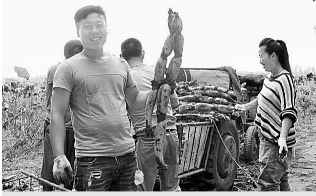
9月16日，民权县庄子镇农民在黄河故道喜收莲藕。据悉，近年来，该镇依托黄河故道丰富的水面资源大力发展莲藕种植，面积近1万亩，大大提高了农民的收入，加快了致富奔小康的步伐。