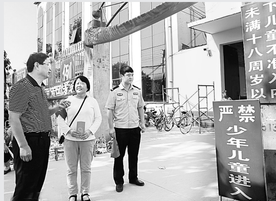
9月16日，宁陵县法律工作者在该县乔四楼基督教教堂内宣传《未成年人保护法》。连日来，宁陵县司法局、教体局等多家单位联合开展法制集中宣传活动，为孩子们筑起安全防护墙。