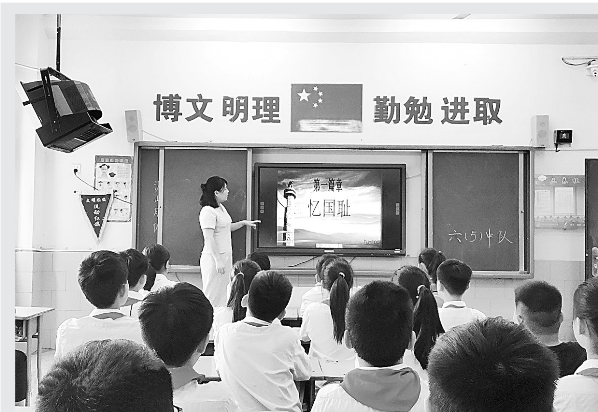
9月17日，梁园新区前进小学开展“勿忘国耻、腾飞中国梦”主题班会。各班通过讲抗日故事、观看爱国主义教育影片等形式，让同学们更多地了解中华民族的屈辱历史，珍惜今天来之不易的幸福生活。

总之，为了激发学生的识字兴趣，提高学生的识字能力，我们在教学过程中应勤于思考，多根据学生的心理和学习特点来对学生识字教学，这样才能探索出一种适合低年级学生的识字教学方法，才能更有效地促进学生的识字能力的增强。