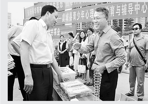
9月17日，虞城县举行2018年“全国科普日、社科普及周广场活动”暨“快乐星期天”主题活动启动仪式，县高中作为承办单位之一参加了此次活动，全面展示了该校科技创新教育的成果。