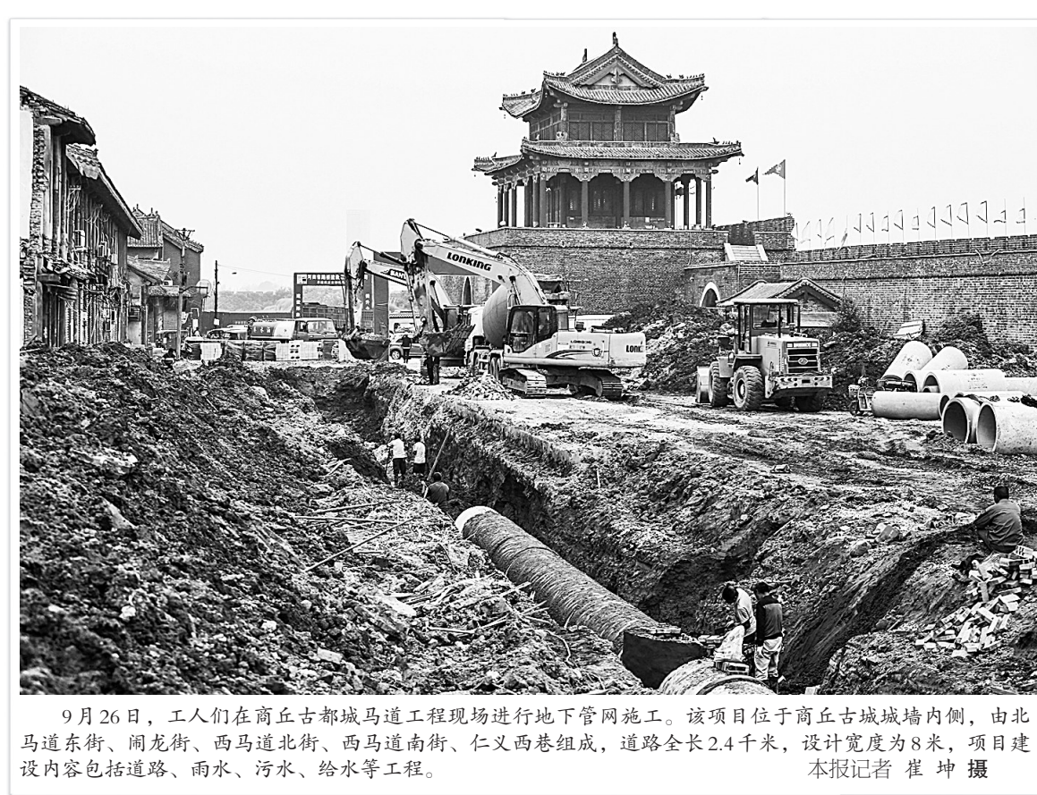
9月26日,工人们在商丘古城城墙内施工现场进行地下管网施工。该项目位于商丘古城城墙内侧,由北马道东街、闹龙街、西马道北街、西马道南街、仁义西街组成,道路全长2.4千米,设计宽度为8米,项目建设内容包括道路、雨水、污水、给水等工程。