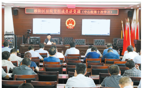
9月21日,睢阳区人民法院开展党组成员讲党课活动。这是该院今年以来组织的中心组第十次学习活动。