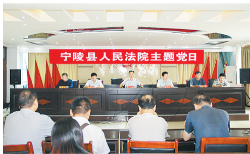
9月20日,宁陵县人民法院开展“主题党日”活动,学习《中国共产党纪律处分条例》《中国共产党党内监督条例》。

执行;充分利用信息化手段,及时查询、查控被执行人名下财产,积极与国土、金融机构等相关职能部门联系沟通,借助各方力量积极查找被执行人的财产,采取查封、扣押、划拨等措施妥善解决一批拖欠工程款、农民工工资的案件。该院对符合救助条件的申请执行人,发放执行救助资金,予以适当救助。此外,该院充分运用“一网通微”及时向社会发布最新执行动态,宣传典型执行案例,并通过加大对失信被执行人曝光力度、限制其高消费等措施,进一步压缩失信人生存空间。