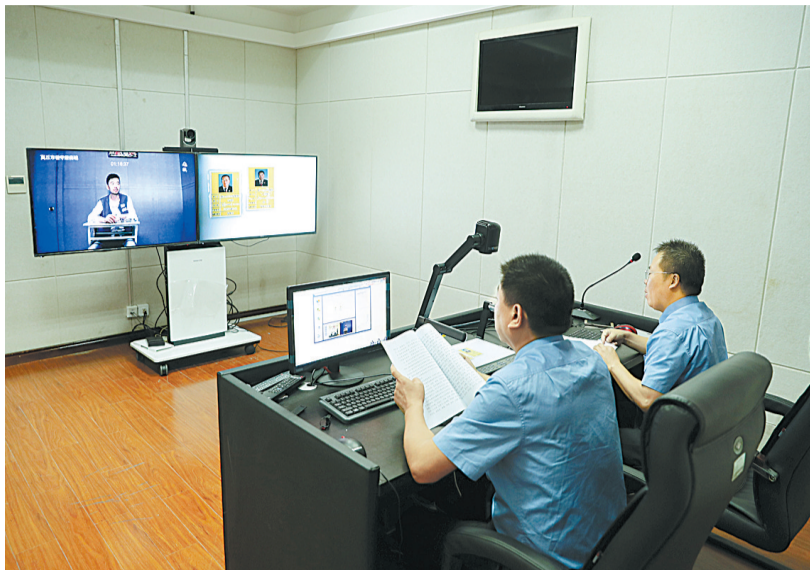
9月19日,市人民检察院公诉处检察官在该院新建成的远程提审室内,对在市看守所羁押、因非法吸收公众存款上诉的马某某进行远程讯问。

近年来,我市检察机关加强智慧检察建设,向科技要战斗力。这次推出的“三远一网”,实现了与法院、看守所及上下两级检察院互联互通,使远程提审、远程开庭、远程送达成为现实,突破了传统的办案模式,有效缓解了案多人少的矛盾。同时,此举也避免了司法机关办案人员的奔波,缩短了办案周期,提高了办案效率,节约了诉讼成本,为全面提升检察业务工作质量和水平提供了坚实的科技保障。