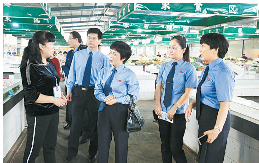
9月20日,梁园区人民检察院联系辖区食药监、工商、市场监督管理等部门,邀请市院民行部门领导,先后到梁园区新建路农贸市场、沃尔玛超市、万嘉鲜智慧农贸市场、前进小学食堂,就食品安全、农产品质量安全、食品加工、食品抽查检验等开展检查,发放检察公益诉讼宣传页,做好公益诉讼职能普法宣传。