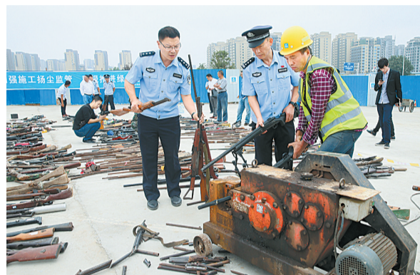
9月20日,我市公安机关举行集中销毁非法枪爆物品活动,共销毁各类非法枪支430余支。打击枪爆违法犯罪专项行动开展以来,全市公安机关共侦办涉枪涉爆案件60起,公诉涉枪涉爆嫌疑人40余人,收缴各类枪支432支、子弹2680余发,对涉枪涉爆犯罪起到了强有力的震慑作用。

22日7时,商丘工学院考点法考各项准备工作全部就绪,工作人员各就各位。7时15分,考生开始入场,人脸识别系统顺利,6个入场通道秩序井然。8时30分,考试开始,整个考点环境安静。省司法厅巡视组、普法办等部门领导全程在考点巡视检查,全天考试工作圆满结束。