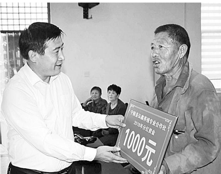
宁陵县弘鑫养殖专业合作社200余名社员代表日前喜领分红。2018年,宁陵县豫东牧业开发有限公司依托弘鑫养殖专业合作社,利用县统筹整合畜牧养殖基地建设资金和产业扶持资金,探索创新出“政府+龙头企业+合作社+基地+贫困户”的能繁母羊集中托管产业扶贫模式,带动华堡、张弓和黄岗镇非贫困村800户建档立卡贫困户入社分红,每户每年1000元,连续分红5年。合同期满后入社贫困户如有意愿想自主家庭养殖的,可与合作社续签协议继续托管养殖,合作社按照每年纯利润的70%继续给入社贫困户分红。弘鑫养殖专业合作社成立不满半年,一次性拿出80万元,提前为入社的800户贫困户每户分红1000元,助推贫困户脱贫致富。