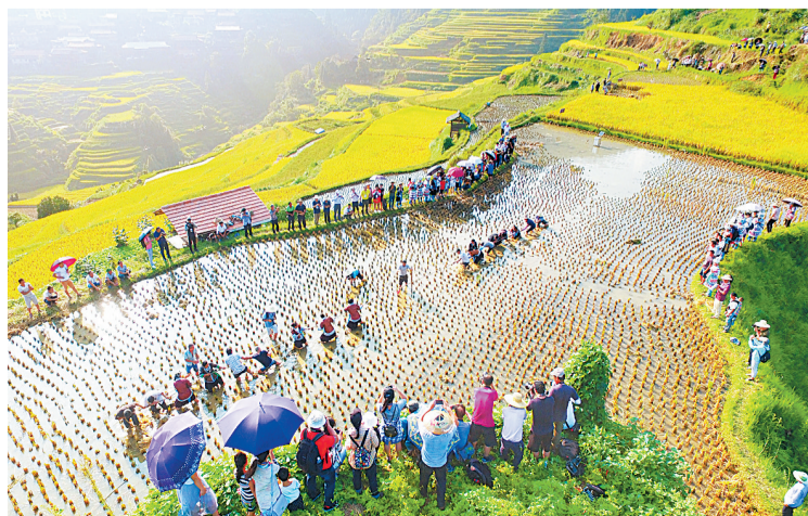
融水苗族自治县首届“中国农民丰收节·融水金秋烧鱼记”活动。