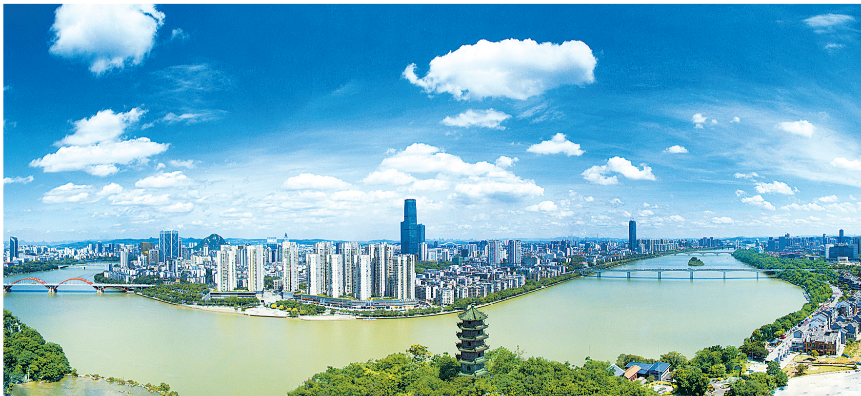
“百里柳江、百里画廊”柳江沿江观光景观带。