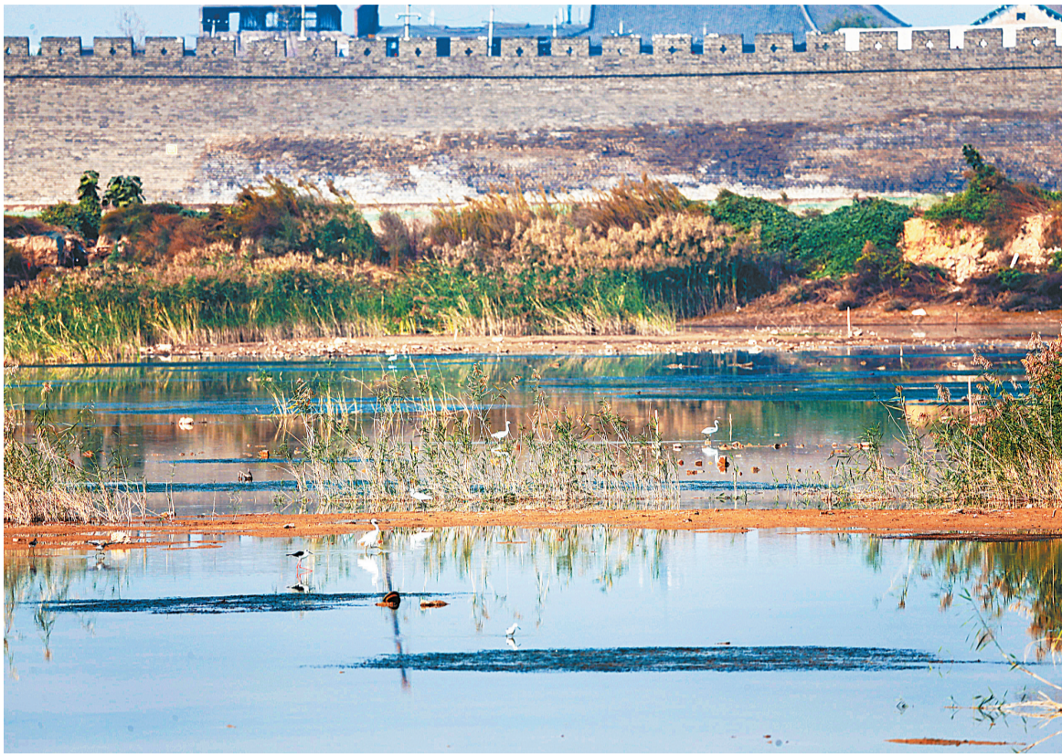
城墙下新试水的东东湖，众鸟云集。