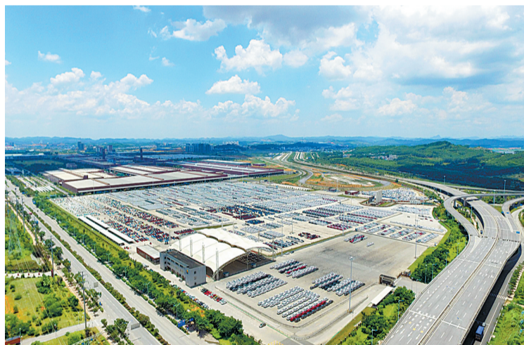
柳州汽车城内整装待发的整车。

十一长假，商丘古城修复性保护与展示工作马不停蹄。一方面开门迎宾喜迎八方来客，一方面古城内外古建土建一派繁忙。环绕巍巍城墙，商丘古城雏形初现，尤其是8000亩城湖恢复快马加鞭。更喜古城东门外，新湖试水，引得万鸟翔集，白鹭灰鹭等众多水鸟不请自来，栖息觅食、追逐嬉戏、优哉游哉。良好生态，和谐共生，自成一景。