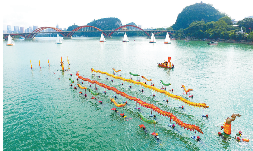
游泳爱好者举着龙的造型畅游柳江。

柳州还是一座生机勃勃的工业名城。工业，承载起这座城市的抱负，为城市前行提供力量。经过长期发展，柳州是全国唯一拥有一汽、东风、上汽和重汽四大汽车集团整车生产企业的城市。中国每生产10辆汽车，就有1辆柳州造。柳钢集团是华南、西南地区最大的钢铁公司；柳工集团是世界工程机械50强企业，装载机产销量居世界第一位。如今的柳州，汽车、钢铁、机械三大支柱产业犹如擎天之柱，优势产业和新兴产业保持着蓬勃向上的活力，夯实了“工业重镇”的名号。