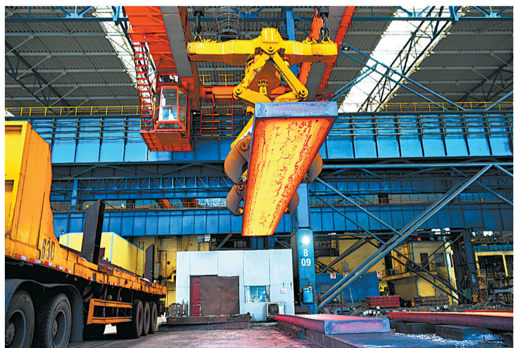
广西柳州钢铁（集团）公司生产车间。