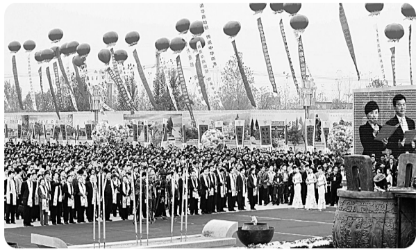
2008年11月6日上午，2008中国·商丘国际华商文化节华商始祖拜谒大典在华商文化广场隆重举行。图为拜谒大典盛况。

节会当天，在商丘市情说明暨项目签约仪式上，数百名海内外客商和我市工商业界人士进行经济合作和项目签约，合作项目覆盖全市各县（区），共有103个投资