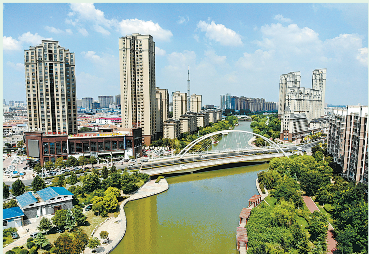
经过治理，市区内的运河成为水质清澈、环境优美、风景宜人的绿色生态景观带。