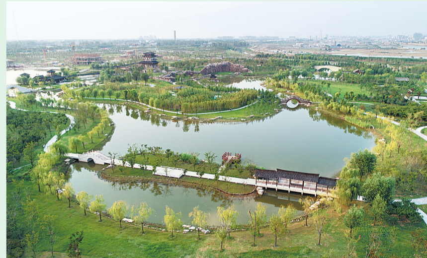
市区的汉梁文化公园草青水碧，风光诗施。