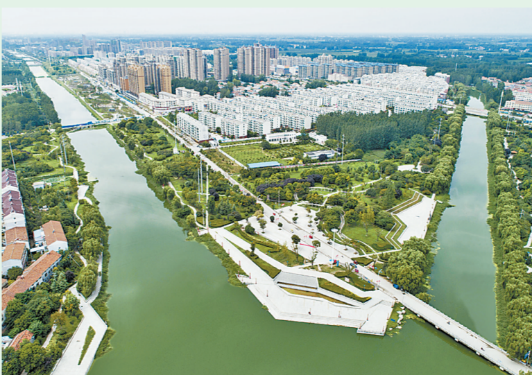
虞城两河口公园沿河而建，水清树秀。