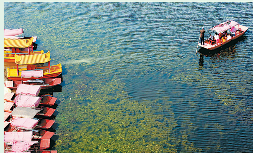
位于梁园区刘口乡的天沐湖清澈见底，吸引着不少游客到此游玩。