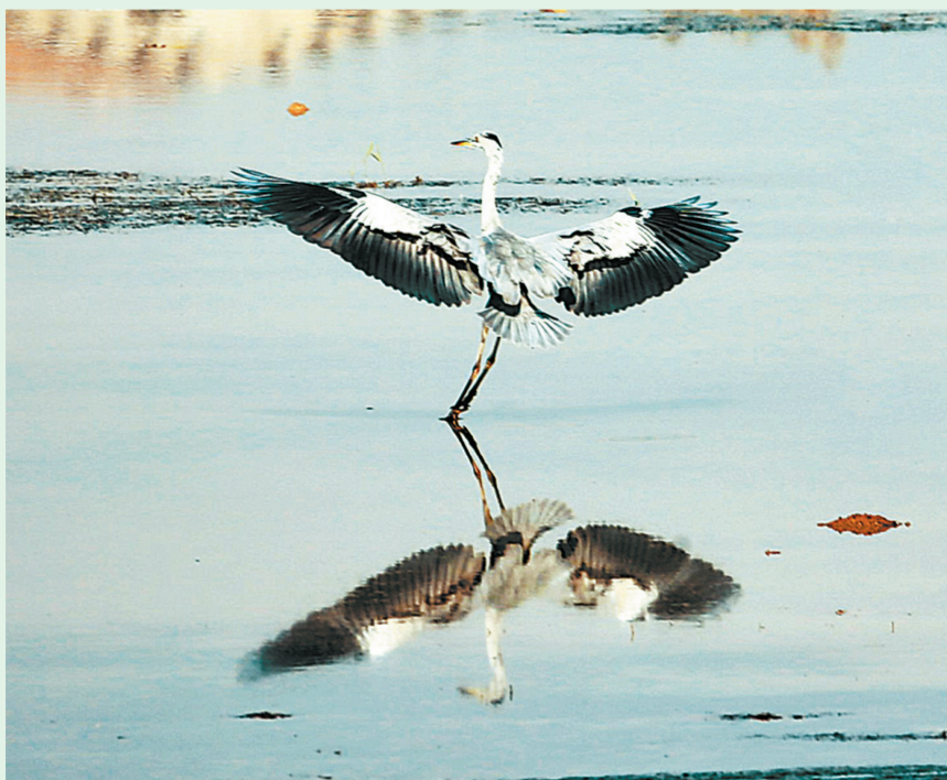
灰鹭起舞。今年十一长假，商丘古城东门外，新湖试水，万千白鹭灰鹭等候鸟不请自来，翩翩起舞、追逐嬉戏，自成一景。