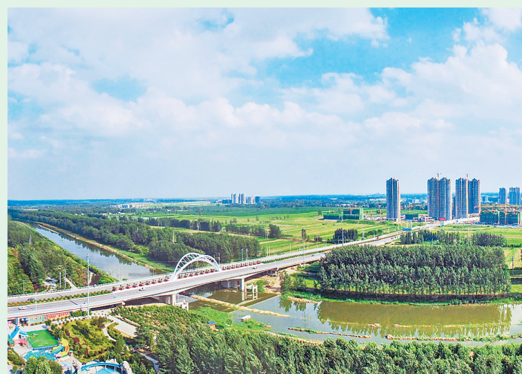
永城市水清河畅岸绿景美。