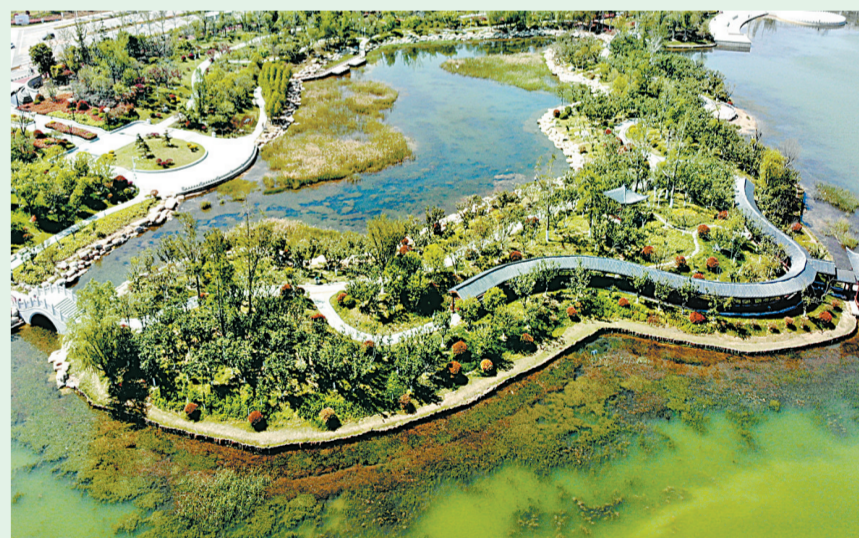
日月湖樱花岛内被数百株樱花树覆盖，在周围水面的映衬下如梦如画。