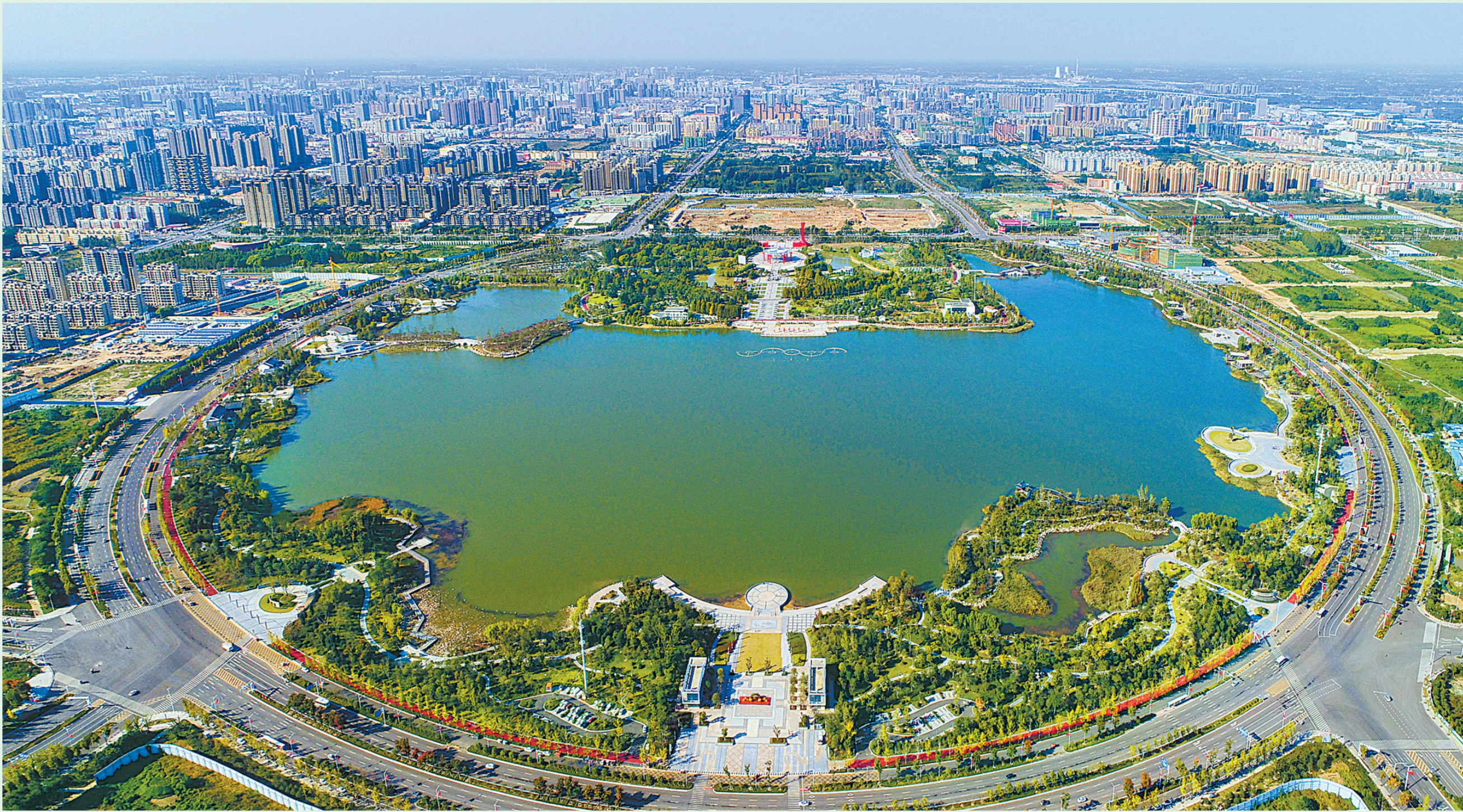
日月湖美景如画，成为了一颗璀璨的城市明珠。