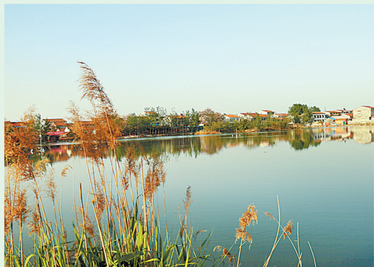
宁陵县东南湖是人们休闲娱乐的好去处。