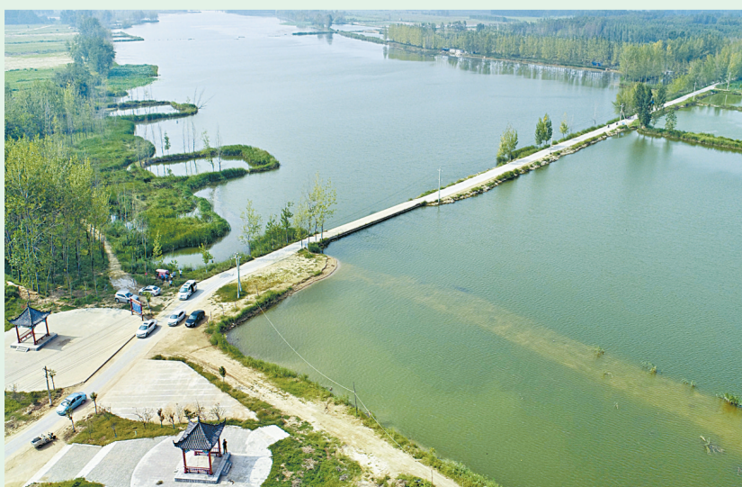
梁园区孙福集乡境内黄河故道波光粼粼，鱼翔浅底。