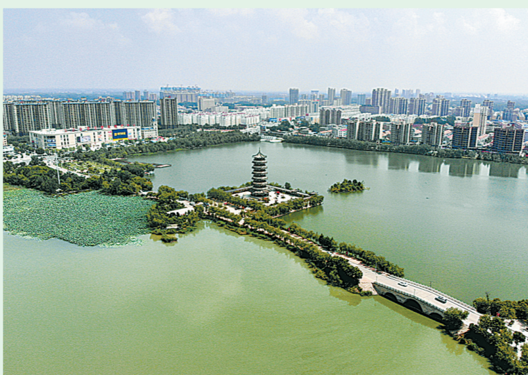
柘城县容湖风光秀丽，拥有丰富的植被和水鸟。