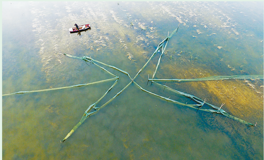
示范区贾寨镇马楼水库碧波荡漾，美不胜收。