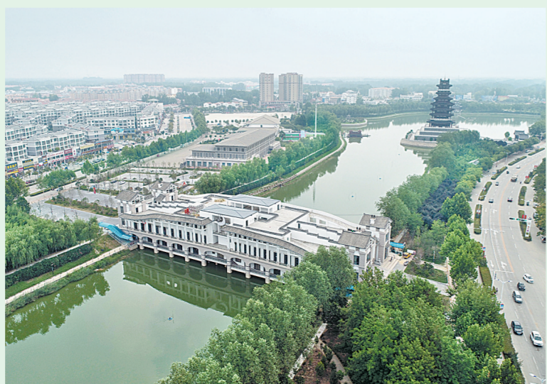
夏邑县古运河穿城而过。