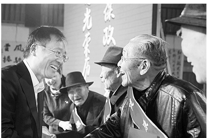
10月16日,宁陵县老干部、老党员等600多人欢聚一堂,共迎重阳节,17名老有所为的先进个人受到表彰。