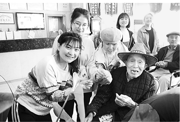
10月14日,商丘师范学院大学生通讯社组织志愿者前往市翠园老年公寓举行“重阳送暖爱心志愿服务活动”,50多名同学前往老年公寓为老人送去节日的祝福。