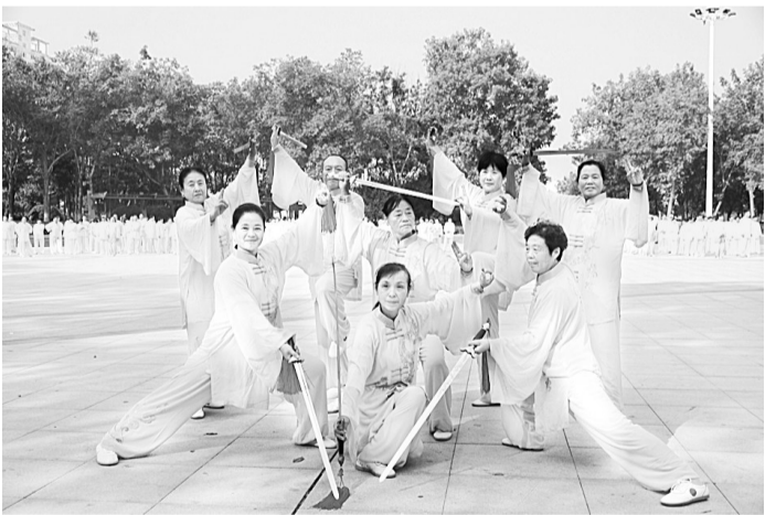
近日,睢阳区委老干部局、区老体协联合举办的老年节庆典暨老年健身活动周启动,来自全区24支健身队伍1000余人展示了大型团体舞蹈、太极拳等健身活动项目。