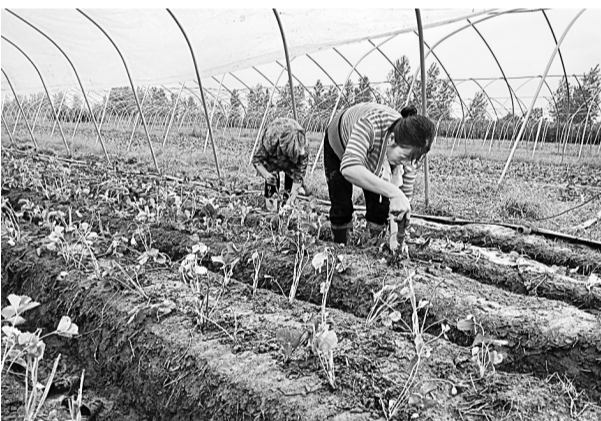
▲10月15日,邵德敏和女儿正在火龙果繁育基地查看花朵授粉情况。柘城县邵园乡马园村村民马志军邵德敏夫妇引进优良火龙果品种,繁育种植10亩火龙果。目前长势良好,已有部分挂果。