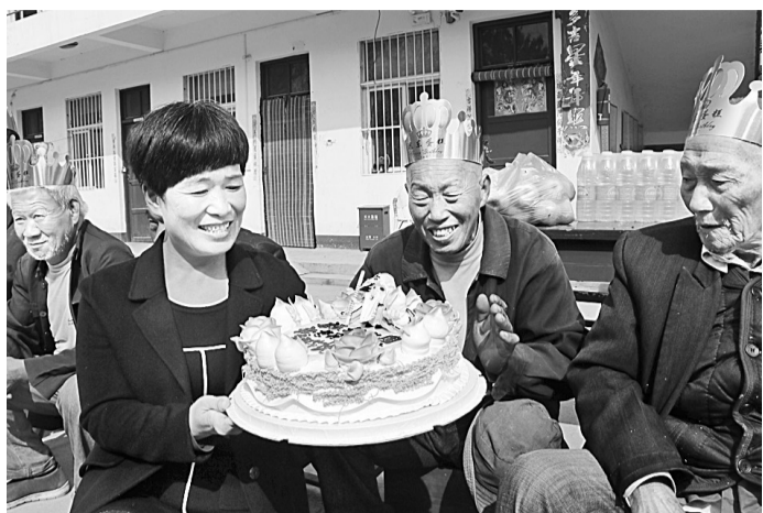
10月16日,宁陵县张弓镇希望教育幼儿园师生走进敬老院,为老人表演了精彩的节目,奉上爱心红包和生日蛋糕。