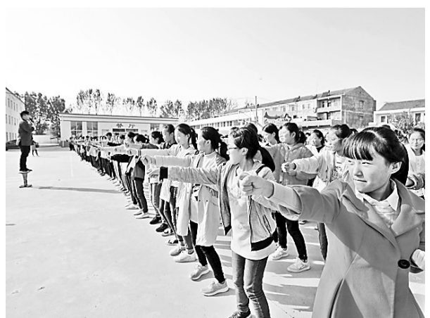
10月18日，商丘咏春拳大师向梁园区冯桥镇中心学校的学生传授咏春拳。为弘扬优秀传统文化，传播美德精神，提升学生综合素质，当日，商丘咏春拳协会、冯桥镇文化站开展了咏春拳进校园活动。