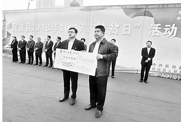
10月17日，民权县农商行在“扶贫日”活动启动仪式上捐款助力脱贫。当日，该县各界干部群众在民生广场参加大型集会，倡议社会各界积极行动起来同心协力扶贫，表彰了一批好媳妇、最美文明家庭、美丽庭院等，共收到社会各界现场捐款150多万元。