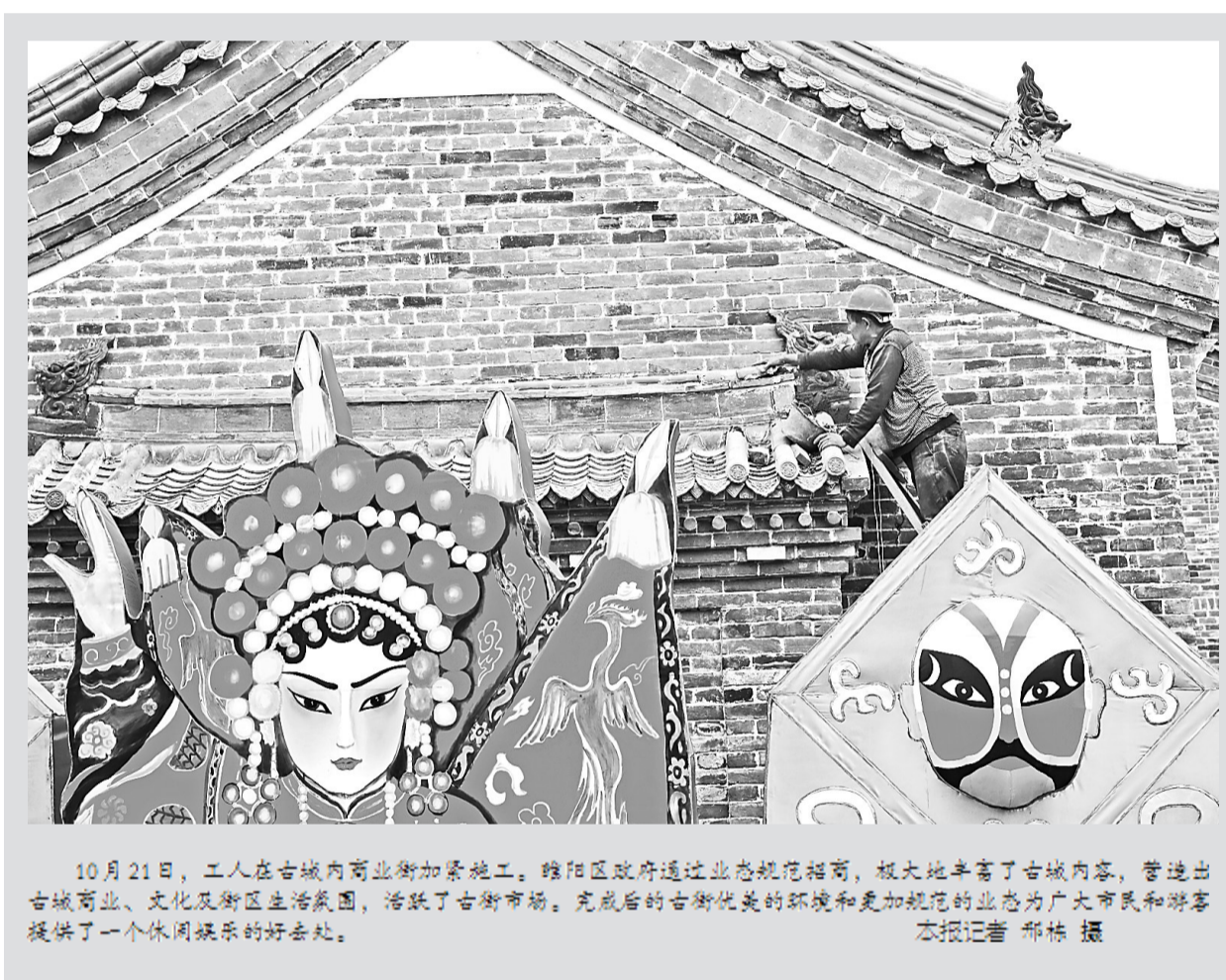
10月21日，工人在古城内商业街加紧施工。睢阳区政府通过业态规范招商，极大地丰富了古城内容，营造出古城商业、文化及街区生活氛围，活跃了古街市场，完成后的古街优美的环境和更加规范的业态为广大市民和游客提供了一个休闲娱乐的好去处。

“我们通过这种暗访的形式，就是想看到学生到底吃的饭菜质量如何、数量够不够，让学生吃好吃饱、让家长和社会放心。”“神秘来客”之中就有宁陵县政府副县长赵向群，她介绍，今后不仅要带相关部门暗访学校餐厅，还要到教体局局长、校长和职能部门负责人每月、每周都要到学校餐厅体验饭菜质量，不开小灶，与学生同吃一锅饭，形成常态化，确保真正把校园食品安全工作做实做真。