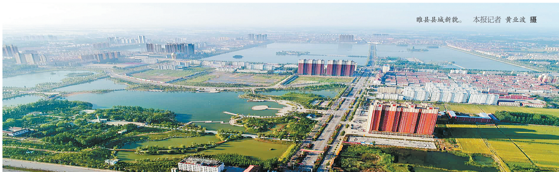
睢县县城新貌。

穿越40年风云岁月，特别是党的十八大以来，睢县已经从封闭走向开放，从边缘走向前沿、从配角变为主角，从贫穷走向富强、从落后走向繁荣，步履铿锵行走在建设美丽富饶、生态宜居、充满活力的现代化新睢县征程上！