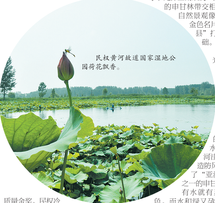
民权黄河故道国家湿地公园荷花飘香。

民权的自然景观和原生态的“长寿元素”构建了民权“长寿品牌”。2016年8月，民权获得“中国森林体验基地”“中国休闲垂钓之乡”“中国长寿之乡”暨“中国健康小城”“全国休闲农业与乡村旅游示范县”和“创建国家全域旅游示范县”称号。