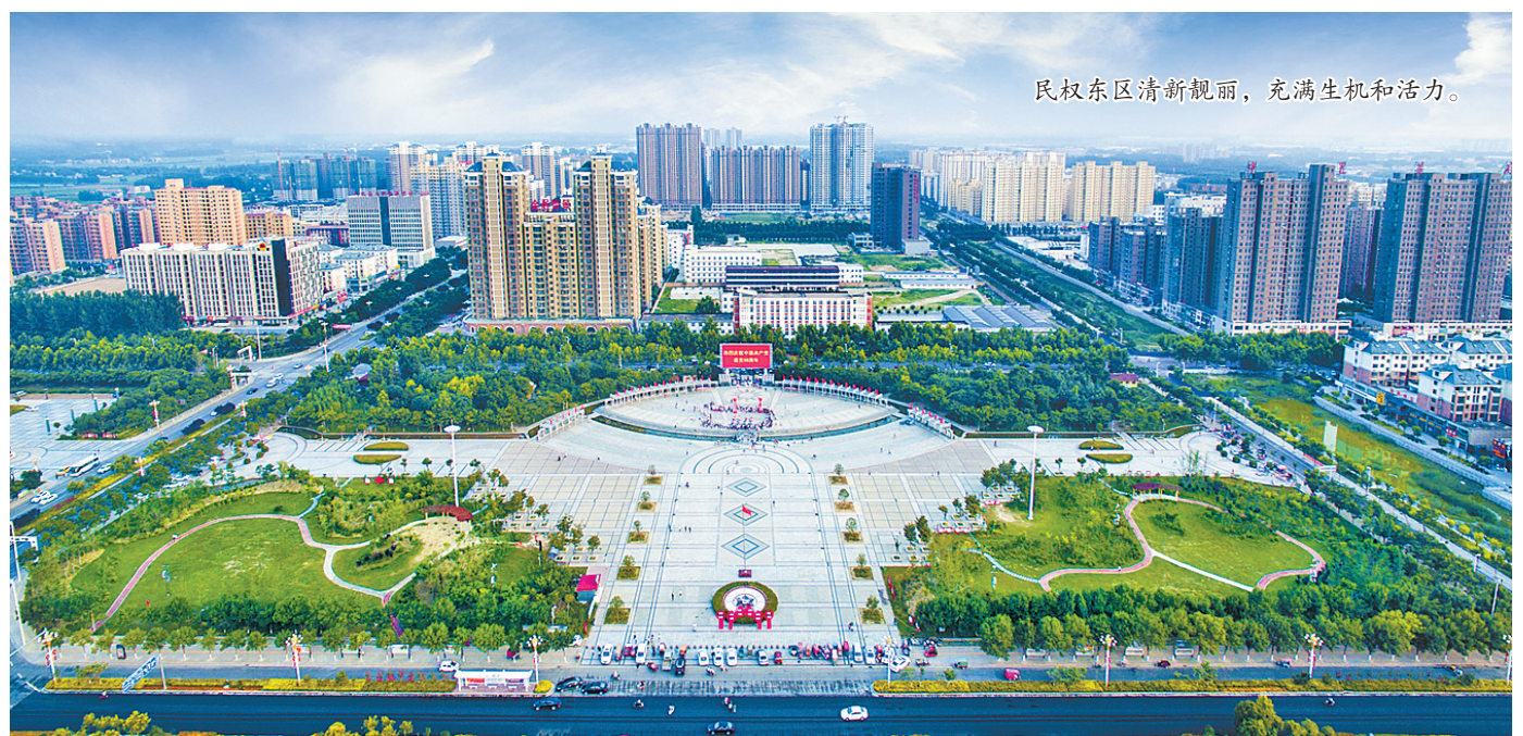
民权东区清新靓丽，充满生机和活力。