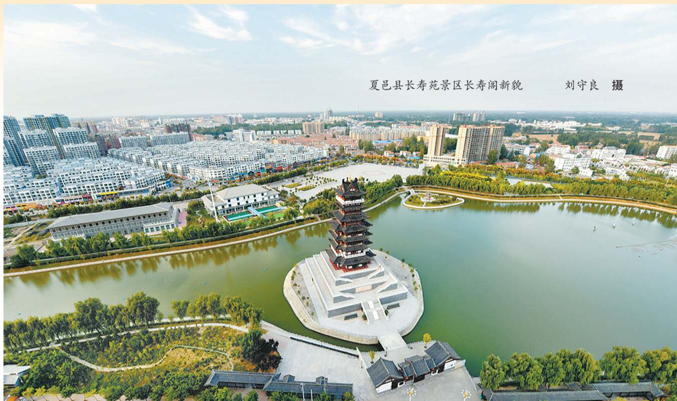
夏邑县长寿阁景区长寿阁新貌

改革开放前,夏邑县城还是“一条道路半条街”,乡村还是“低矮的草房苦涩的井水”,是全面发展、全速推进的改革开放历史征程,让夏邑城乡变了模样。改革开放以来尤其是党的十八大以来,夏邑县委、县政府团结带领全县人民,锐意改革,攻坚克难,区域经济跨越发展、社会事业全面进步、生态环境不断改善、人民生活水平大幅提高,实现了由贫穷落后到富裕文明的巨变。