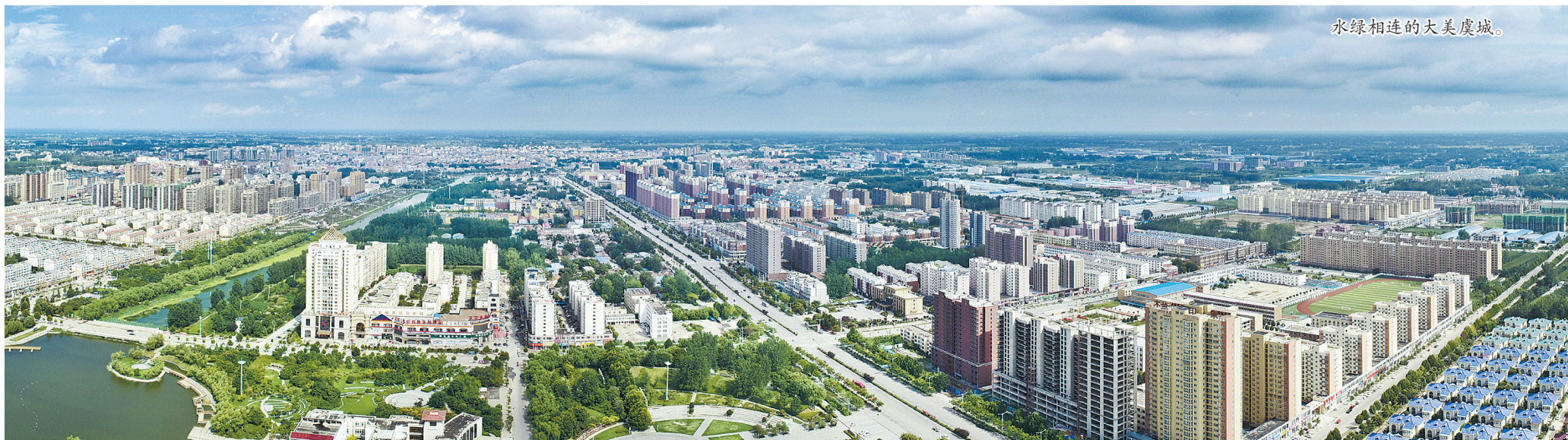
水绿相连的大美虞城。