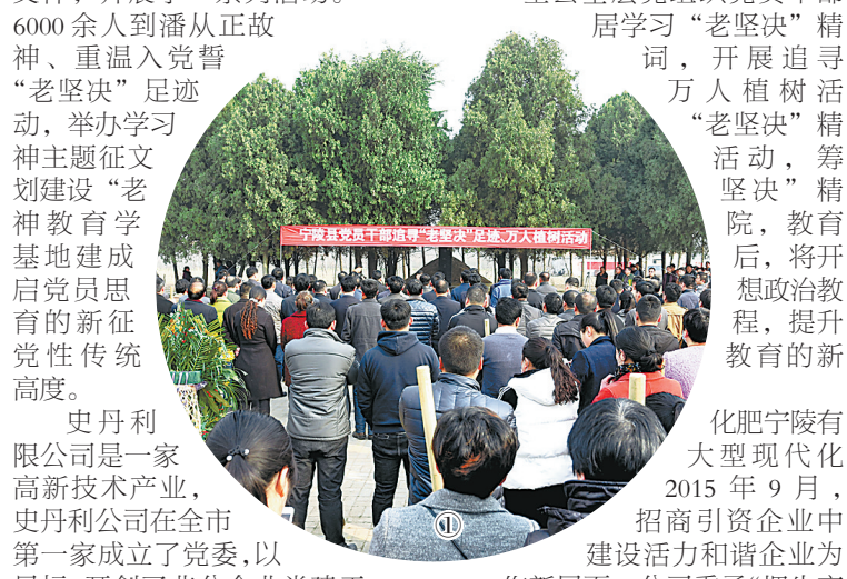
图① 全县基层党组织党员干部6000余人集中到潘从正故居学习“老坚决”精神、重温入党誓词，开展追寻“老坚决”足迹万人植树活动。

围绕“加强作风建设，助推宁陵发展”主题，宁陵在各乡镇、县直各单位领导班子和领导干部中，重点解决领导班子和领导干部在作风方面存在的突出问题，提出整改方向，完善整改措施，促进工作落实。建立领导干部“双向约谈”机制，着力畅通组织部门与党员干部沟通交流渠道，充分发挥组织部门对党员干部关爱、警示提醒、监督管理的重要作用，努力营造党建浓厚氛围，激发党员干部干事创业热情。