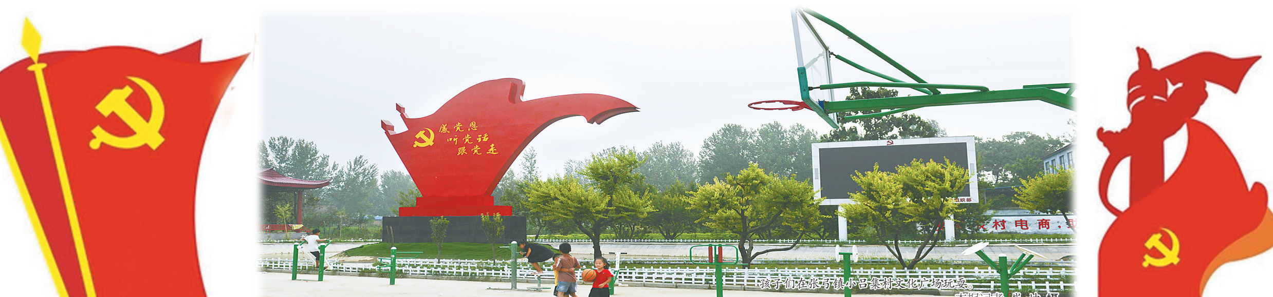
不忘初心 牢记使命