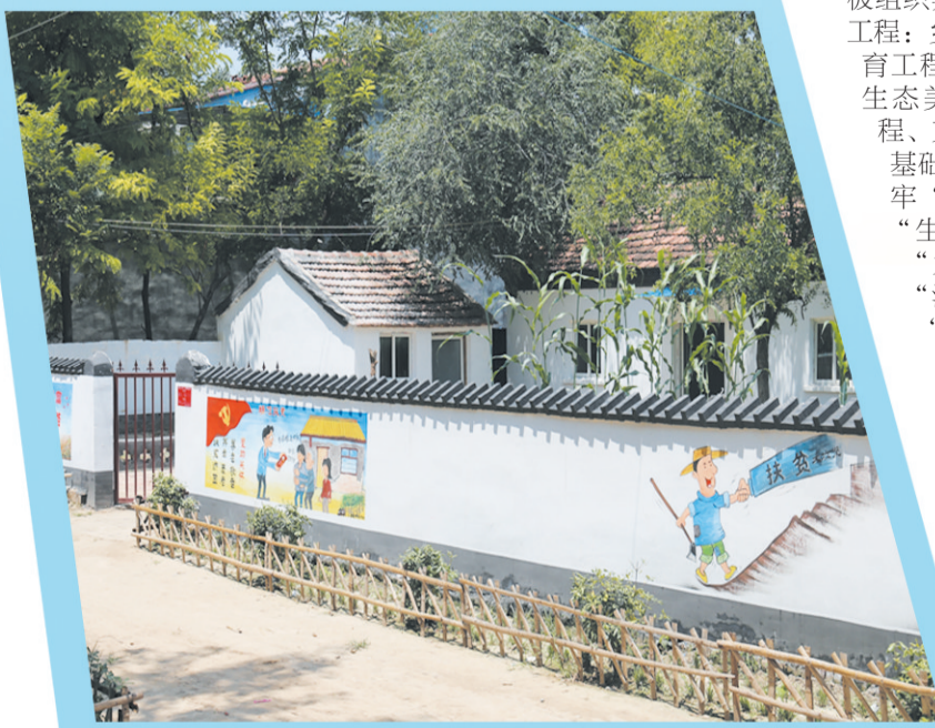
宋集镇大邓楼村“六改”提升后的贫困户家。