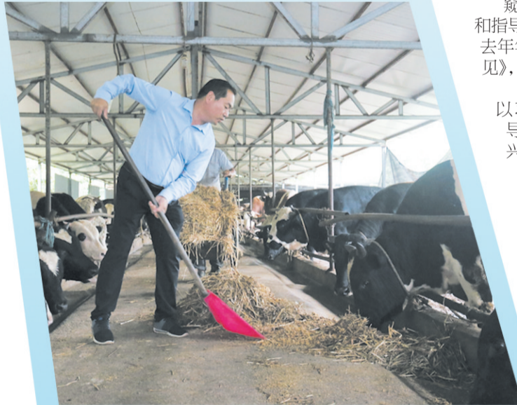
毛垵镇元宝养殖场以产业发展推动乡村振兴。