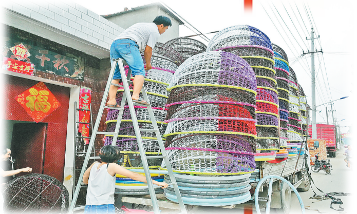
临河店乡程庄村藤编产业编织群众致富梦。