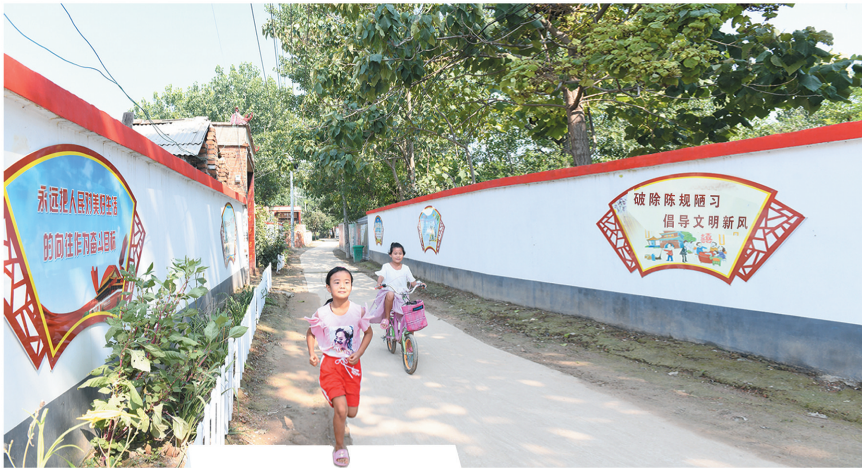
脚下是平整的水泥路，两侧是多彩的文化墙，冯桥镇安楼村村容村貌因脱贫攻坚而发生了巨大变化。

豫东的初秋，天空湛蓝，秋高气爽，硕果累累，瓜果飘香，田野里到处都是一派丰收的景象。平整的马路四通八达，沿街的墙壁粉刷一新，门前的坑塘一汪碧水，屋旁的花草红绿相间，贫困户的小院旧貌换新颜，扶贫车间里生产正忙订单……穿行在睢阳区的村村镇镇，宜居宜业的乡村美景和以脱贫攻坚助推乡村振兴的生动局面随处可见。近年来，睢阳区坚持以党建为统领，以全面同步小康为目标，以脱贫攻坚为主线，坚持美丽乡村建设和乡风文明建设并重，全力打造“产业兴旺、生态宜居、乡风文明、治理有效、生活富裕”的幸福家园，人民群众的获得感、幸福感大幅提升。