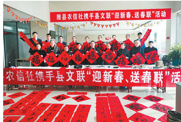
近日,睢县县委宣传部、睢县文联、睢县信联社联合举办“送福进万家,为群文义写春联”活动。

李永舫院士从事科研工作52年来,奋战在科学研究的第一线,矢志不渝,不懈奋斗,勇攀科学高峰,在有机化学、聚合物太阳能电池光伏材料等领域取得了累累硕果,成就斐然,多项科研成果填补国内空白,开创和引领中国高分子化学研究处于国际领先地位。