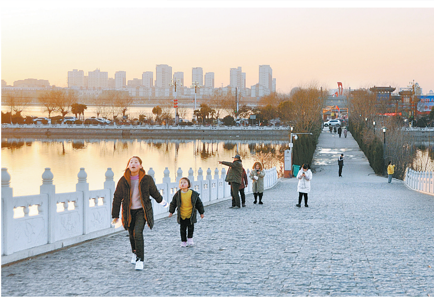
1月23日,游客在睢县北湖景区观光游玩。随着春节临近,睢县各景区设施不断完善,环境质量进一步提高,成为游客休闲度假的好去处。

祝你们新春愉快、事业兴旺、阖家幸福、万事如意! 中共睢县县委书记 吴海燕 睢县人民政府县长 曹广阔 2019年1月21日