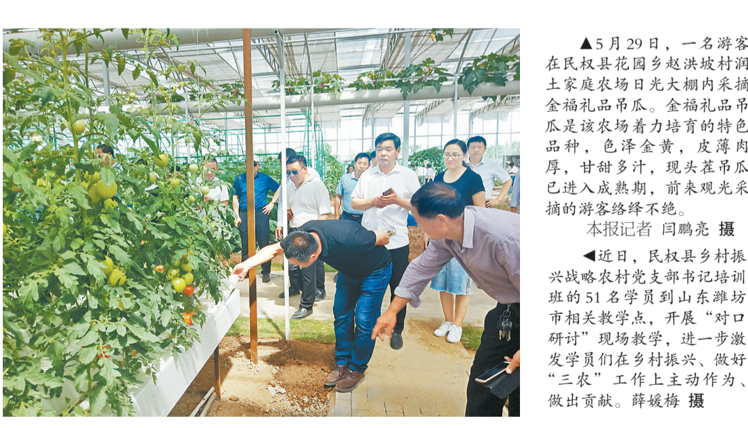
▲5月29日,一名游客在民权县花园乡赵洪坡村洞土家庭农场日光大棚内采摘金福礼品吊瓜。金福礼品吊瓜是该农场着力培育的特色品种,色泽金黄,皮薄肉厚,甘甜多汁,现头茬吊瓜已进入成熟期,前来观光采摘的游客络绎不绝。