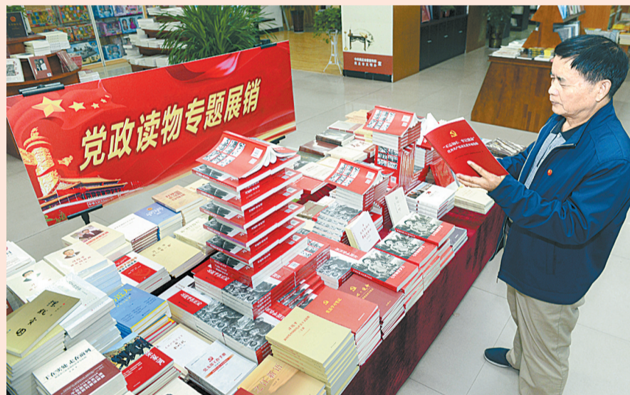
10月9日，市民在新华书店内选购图书。在市新华书店一楼新中国成立70周年党政读物专题展销柜台上，陈列着新中国70年来的奋斗史书籍以及重点党政图书，为市民提供正能量、有深度的优秀图书。