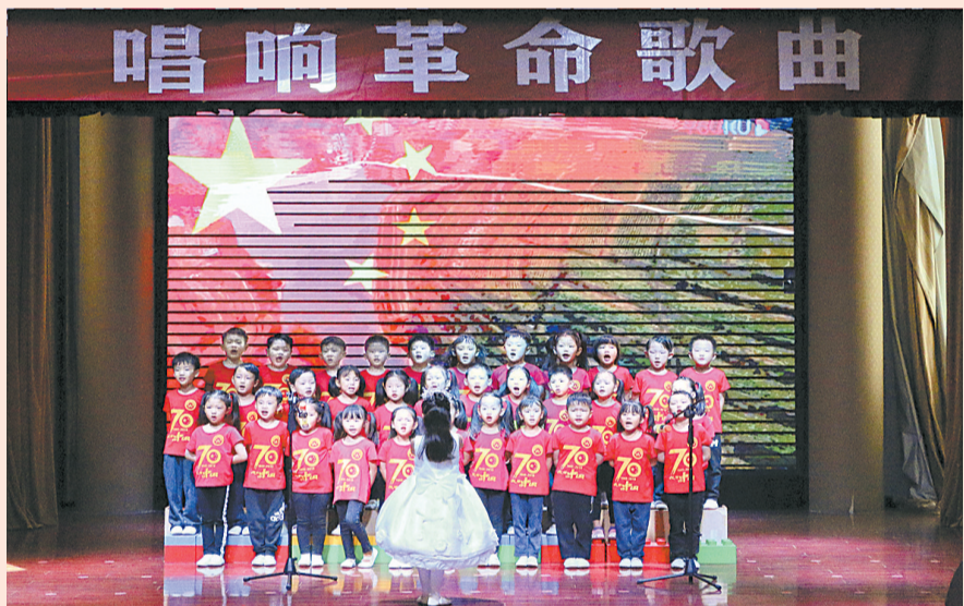
10月8日，睢阳区博睿蓝天幼儿园的孩子们在合唱歌曲《我和我的祖国》。当天，该幼儿园开展“唱响革命歌曲”教育活动，激发孩子们的爱国主义情感，让孩子们通过歌声抒发对祖国的热爱之情。