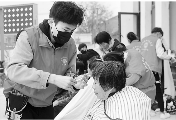
11月18日，志愿者在为老人们免费理发。当日，睢阳区总工会组织志愿者来到帮扶点临河店乡刘玉池村，为老人们提供免费理发服务。本报记者 崔坤 摄