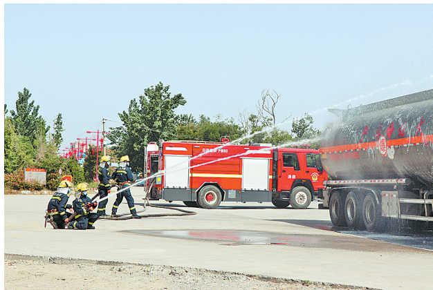
5月12日，虞城县公安局交警大队联合县消防大队和120急救中心，开展道路交通应急救援演练活动。图为民警在危化品泄露事故现场疏导分流群众、车辆，隔离现场，消防队员快速打开水枪施救。