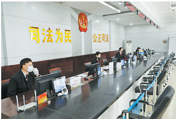
市中级人民法院立案大厅诉讼服务中心，从便民利民的角度优化功能分区，开辟特殊诉讼“绿色通道”。