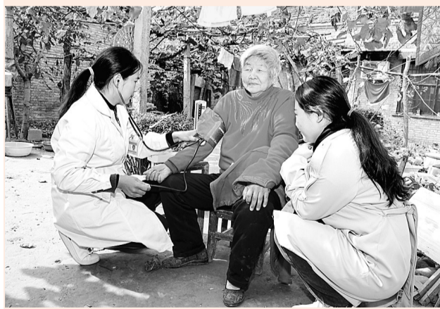
10月21日，民权县人和镇卫生院的签约医生在贫困户家入户随访。家庭医生携带着听诊器、血压计等医疗设备，为贫困户进行健康检查和用药指导，现场解答疾病咨询，为他们树立了战胜疾病、早日实现脱贫的信心。