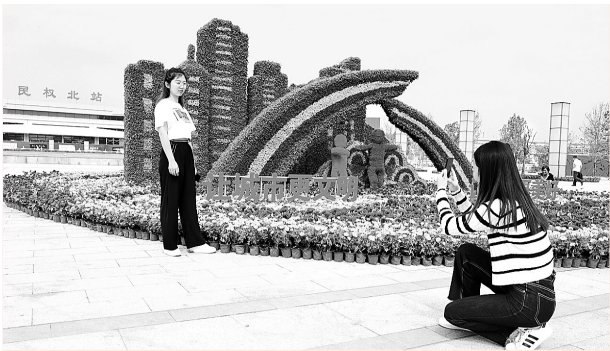
10月19日，市民在民权县高铁广场花雕前驻足拍照。随着该县创建“全国文明城”活动的深入开展，城市绿了、美了，一些街头绿地、鲜花造型成了市民游玩“打卡地”。

在今春的新冠疫情防控中，该公司经理刘军带领员工守好24小时卡点，确保小区居民健康。在“两城”联创中员工加班加点，提升小区环境卫生质量，打造了商丘市小区创建的亮点，受到市区领导的好评，为清江社区夺得锦旗。杰诚物业还自筹经费完善小区技防，安装高清全景视频监控摄像头35个，编织“天罗地网”为居民保平安。26台电梯经过努力协调，已逐步落实全部大修与更换。今冬都会国际小区将实现集中供暖。为方便业主，在单元楼门口设置无障碍通道6个。基础设施的综合整治，基本解决了小区的治安、卫生、环境等方面的突出问题，保障了居民生活环境安全。