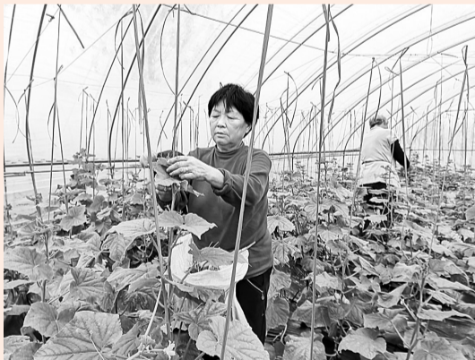
10月22日，在梁园区观堂镇程楼村的温棚黄瓜种植基地里，两名员工正忙着给黄瓜秧整枝、吊秧。近年来，该村因地制宜，加快农业产业结构调整升级，引导群众走“合作社+农户”经营模式，有效扩大了蔬菜种植规模，拓宽了农民增收致富渠道。