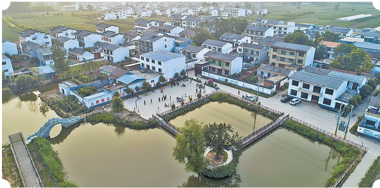
航拍张阁镇大刘村。