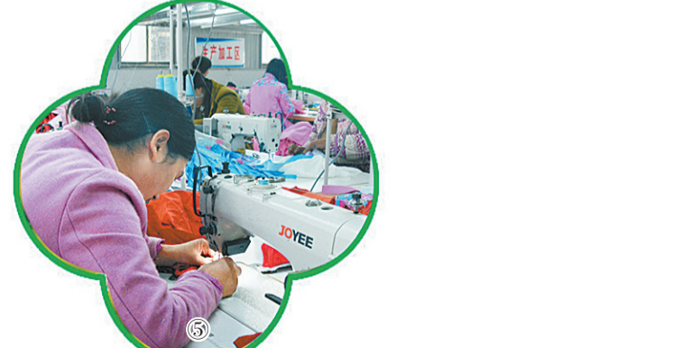
①鸟瞰美丽如画的梁园城区。 赵冲 摄 ②开展疫情防控应急演练，做到召之即来，来之能战。 本报记者 单保良 摄 ③升级改造后的人民公园一景。 赵冲 摄 ④在家门口打工挣钱的贫困群众。 本报记者 单保良 摄 ⑤贫困村扶贫车间生产出口服装。 本报记者 单保良 摄