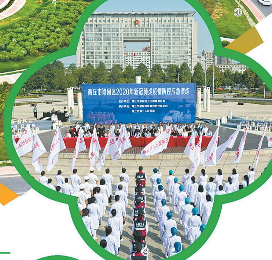
梁园区2020年新冠肺炎疫情防控应急演练

逆势而上，克难攻坚，在全力保障人民群众生命安全的同时，科学推进复工复产、复商复学，接连打赢了脱贫攻坚、产业调整、城市创建、安置区建设等连场战役，实现了各项事业在困境中出彩出新，这一年，以党的建设高质量推动经济发展高质量的理念在梁园得到很好的践行。