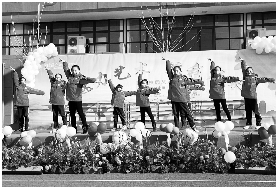
我的舞台我做主,我的风采我展现。为丰富校园文化生活,促进学生个性全面发展,近日,宁陵县立源实验学校举行了首届校园艺术节。舞蹈、乐器、小品、朗诵等节目精彩纷呈,让人目不暇接,引得观众频频叫好。