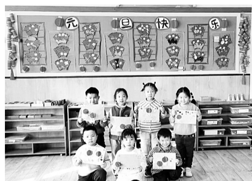
为了让幼儿加深对元旦的认识和了解,近日,市第三幼儿园举办了“红红火火迎新年 快快乐乐庆元旦”主题教育活动。活动中,老师和孩子们对教室进行了装饰,挂起了灯笼、贴上了窗花,制作了贺卡、糖葫芦,增添了节日气氛。