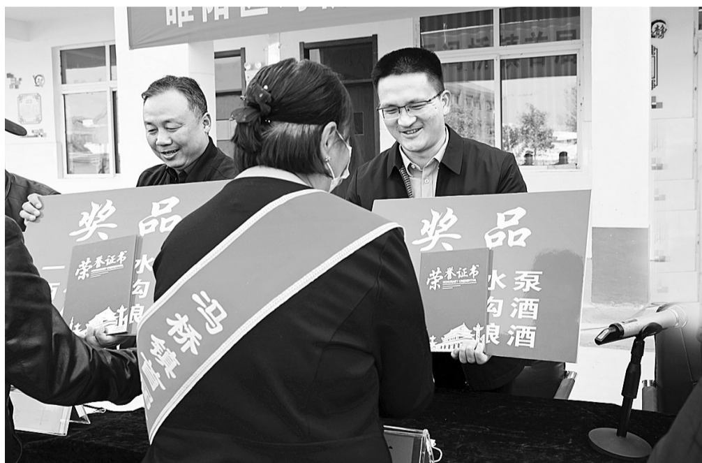
4月10日，睢阳区坞墙镇表彰一批在种植业、养殖业、工业企业、商业、服务业、电商等各个行业大施所能、大展才华、大显身手的典型代表人物。“十大致富状元”的评选，将引导更多有志青年积极投身家乡建设。本报记者 邵群峰 摄