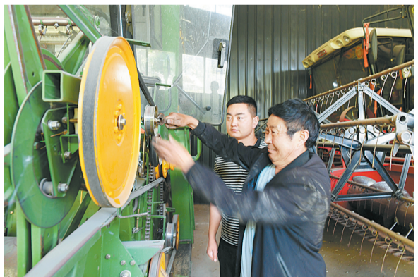
5月25日，睢县白楼乡海涛农机专业合作社农技技术人员在检修小麦收割机。

近年来，睢县农机局以创新、创造、创未来的工作思路，加强与多方高科技公司的交流与合作，多渠道引进智能化农机，把农机新技术、新机具推广工作与购置补贴政策结合起来，与基层农机推广体系改革和项目建设结合起来，与生产企业及经销商企业开展的演示活动结合起来，与深耕深松项目实施结合起来，与农机合作社、种植大户、农机大户结合起来，让农机新技术在农业高质量发展中发挥更大作用，相继获得全国平安农机示范县、全国主要农作物全程机械化示范县等多项国家、省、市级荣誉称号。