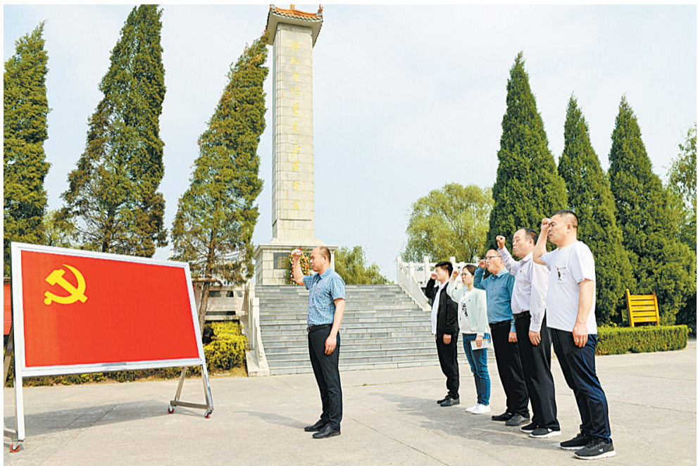
《商丘日报》“百年华诞寻初心”采访组在睢杞战役烈士陵园纪念碑前重温入党誓词。