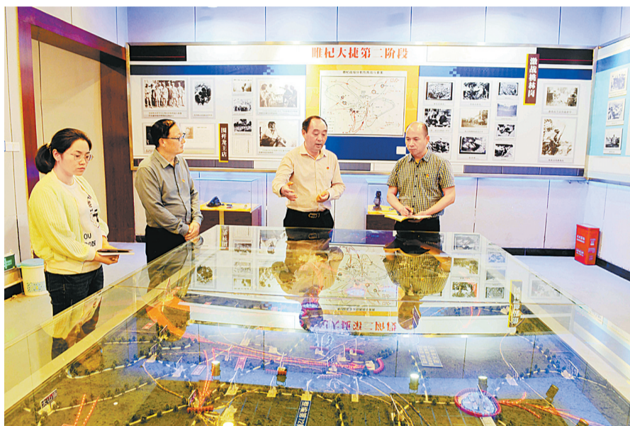
采访组在睢杞战役事迹陈列馆采访战役经过。