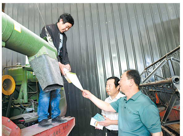
图为睢县农机局技术人员在为农机手发放《农机安全作业明白纸》。