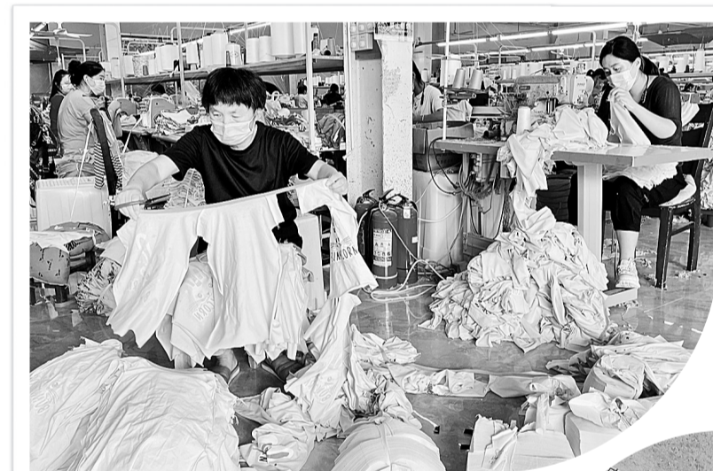
9月8日,睢阳区产业集聚区米诺儿服饰的工人在制衣车间忙碌着。连日来,睢阳区产业集聚区管委会统筹抓好工业企业疫情防控和生产经营,积极帮助企业解决用工、原材料、资金、设备等方面的困难和问题,助推企业健康发展。本报记者 崔坤摄