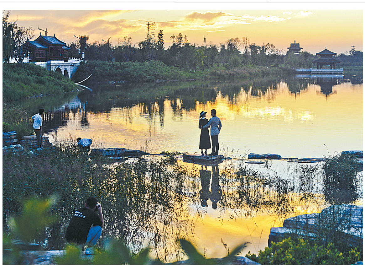
9月7日，一对新人在商丘古城湖拍摄婚纱照。当日，我市迎来晴好天气，日落时分天空出现绚丽晚霞，夕阳映射云层，霞光万丈，宛如油画。 本报记者 崔坤 摄

9月7日晚，工作人员在对南京路路灯进行维护。连日来，城市照明管理处加大对城区街巷道路、背街小巷、公园绿地的路灯及景观照明设施维护力度，确保群众出行方便。 本报记者 崔坤 摄