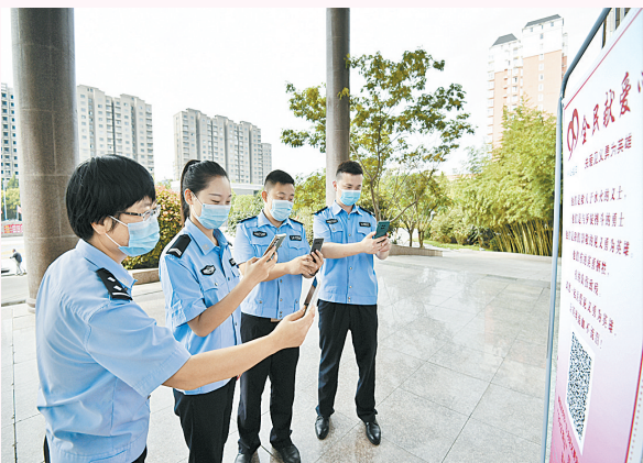
9月7日，夏邑县公安局举行“99公益日”见义勇为募捐启动仪式，民警扫描二维码献爱心。

永城县、夏邑县、柘城县、宁陵县、睢县见义勇为协会先后召开募捐动员会，虞城县、睢阳区见义勇为协会充分发挥市、县、乡三级组织建设优势，深入动员所