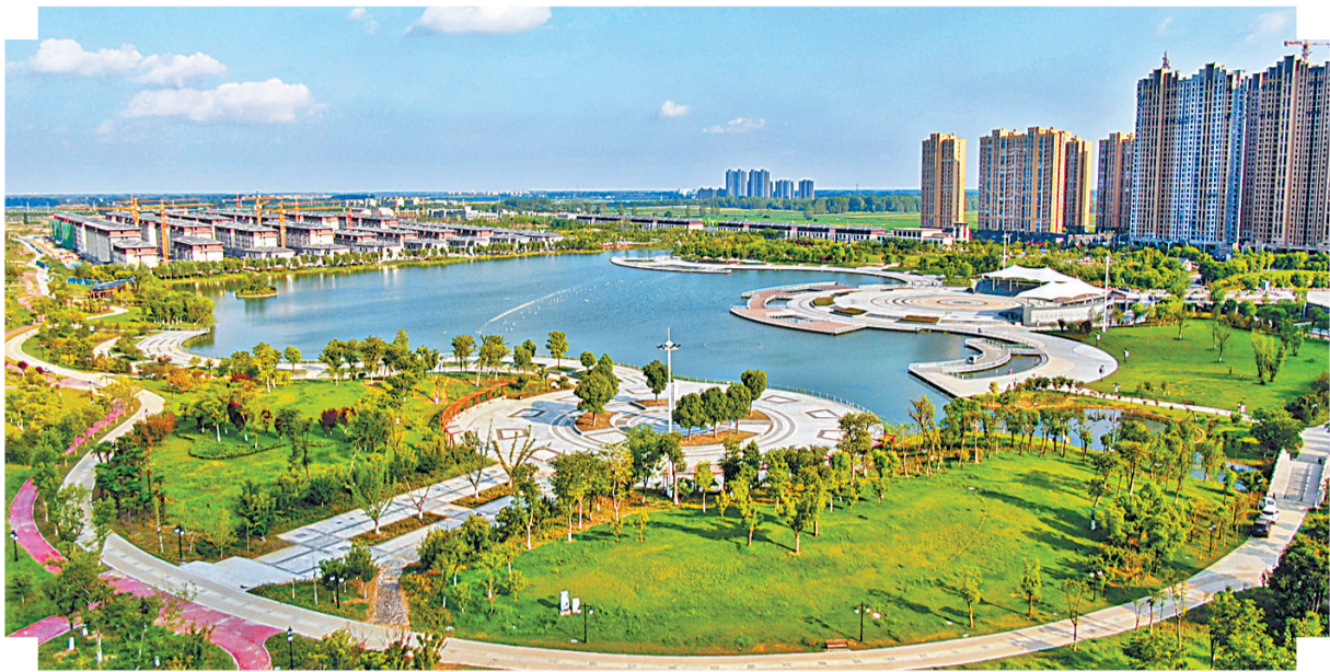
永城市沱南生态广场。