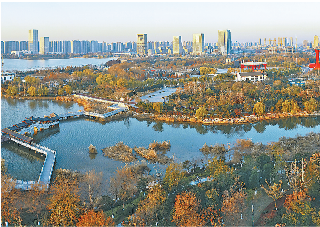
12月12日,暖阳照射下的日月湖景区(无人机照片)。冬日,日月湖景区也变得色调分明,都在尽力地展示最动人的一面。红色、黄色、绿色相互交织在一起,如彩带,似锦绣,一湖碧水静静地躺在“彩霞”之间,闪烁着碧蓝色的光。

加强监督,严格管理。通过党史学习教育,把纪律规矩贯穿到一言一行中,进一步增强纪律观念。严格履行监督管理职责,通过日常考核、电子监察,抓早抓小、防微杜渐,不搞无原则的一团和气,杜绝“门难进、脸难看、话难听、事难办”和“冷、硬、推、拖”等歪风邪气。