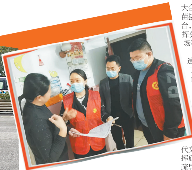
▲志愿者入户发放关于深化全国文明城市创建工作问卷调查。 ▲志愿者帮扶老人过马路。

为加快推进全国文明城市建设步伐,营造全民参与深化全国文明城市创建工作的浓厚氛围,中州街道办事处多次开展深化全国文明城市创建工作宣传活动。从“文明实践、志愿有我”到“文明实践、志愿同行”,中州街道办事处的党员志愿者们通过悬挂宣传条幅、发放宣传手册、开展文明交通、清理小广告、清除杂草垃