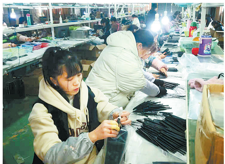
1月5日,睢县尤吉屯乡周楼村扶贫车间内,女工们在加工电子元件。该县妇联通过创建“巧媳妇”创业就业示范基地,激发农村留守妇女创业致富的内生动力,引导她们克服“等、靠、要”的思想,促进她们居家灵活就业。

行业商会11个、睢县在外异地商会3个、异地睢县商会2个。深入开展“万人助万企”活动,聚焦企业发展重点难点堵点问题,真心为企业办实事、解难题。目前,在睢县民营企业诉求智慧响应平台入驻注册民营企业3608家,入驻涉企部门47家。继续抓好“百企兴百村”工程,以睢县118个脱贫成果巩固村和31个乡村振兴重点村为帮扶对象。开展“情暖夕阳”活动,帮扶21家敬老院;13家本地直属行业商会资助10.6万元,资助45名贫困大学生。