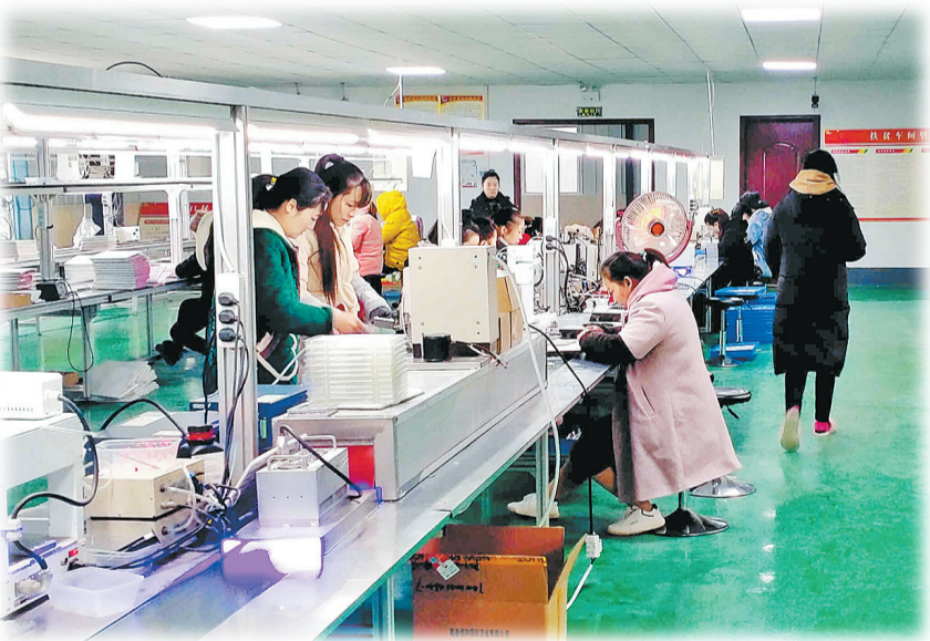
1月5日,河堤乡马路口村聆音电子有限公司扶贫车间内,工人忙着穿线、焊接、包装。

“现在我们乡制鞋、电子、酿酒、粉条加工等产业发展得红红火火;种植、养殖产业棚满兴旺,村民们不但能到车间、基地务工,还可以领料在家加