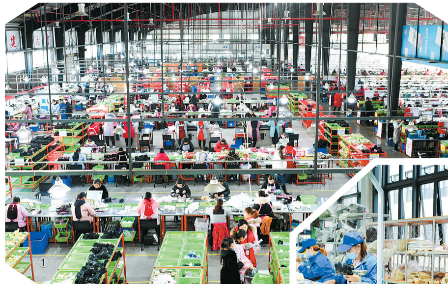
图①:河南嘉鸿鞋业生产车间

据悉,去年以来,睢县为提升项目建设速度,深入开展“万人助万企”活动,深化集聚区“管委会+公司”改革和“放管服”改革,全面实施“腾笼换鸟”“筑巢引凤”和闲置土地专项整治工程,落实企业“入驻即生产”经验,强力推进机制、重大项目联审联批周例会、城建项目联审联批周例会、“月督查、季观摩、年总评”和“一清单、四机制”等工作制度落实;在服务上从有求必应的“店小二”服务,到主动