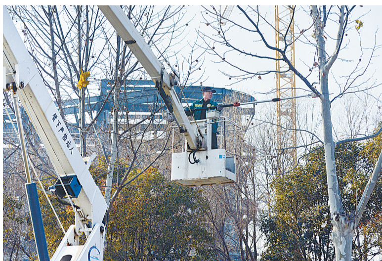
2月24日，园林工人在中州南路对行道树进行修剪作业，在消除安全隐患的同时进一步提升绿化景观效果，美化城市环境。