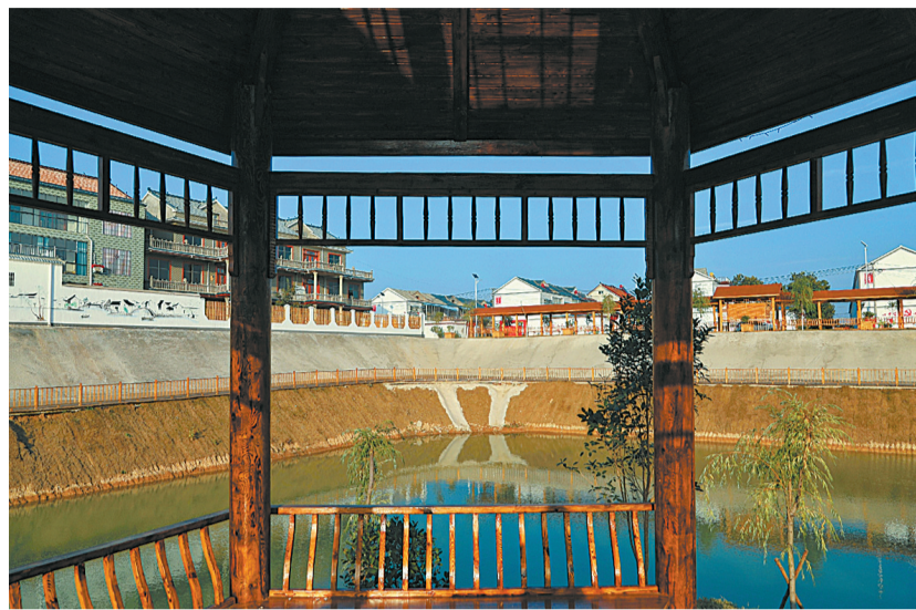
整治后的义醒岗村坑塘一角。

在省道207一处十字路口，园林工人们正抢抓时间栽植植楠、冬青球、大叶黄阳等绿化苗木，这里是通往周边4个行政村的主干道，常住人口有1万多人，也是正在设计施工的高标准